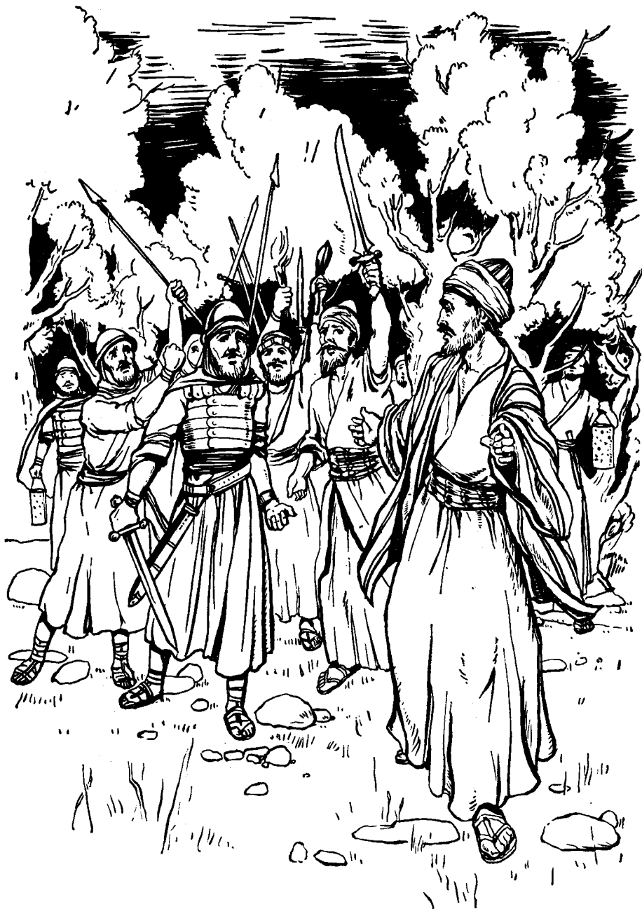
Judas Iscariote ki koos ngérög.